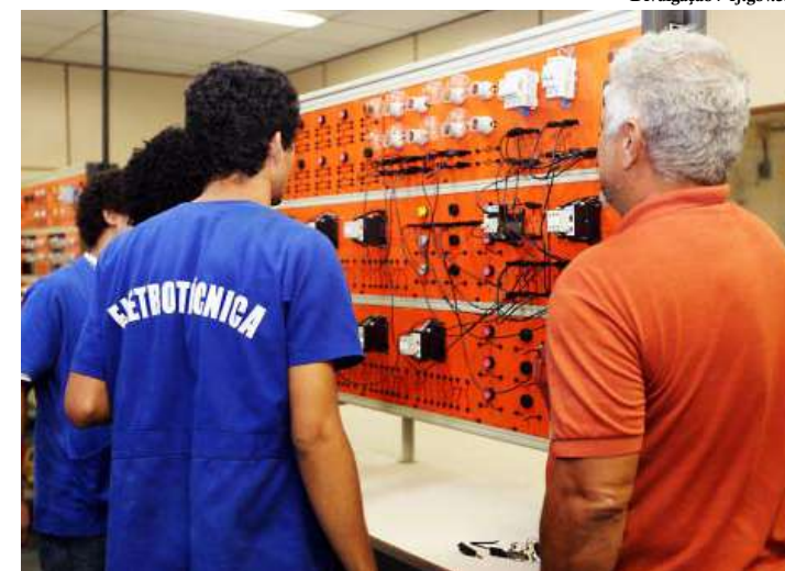
Interessados devem ler o edital e conferir os requisitos necessários para o ingresso

A Fundação de Apoio à Escola Técnica (Faetec), vinculada à Secretaria de Ciência, Tecnologia e Inovação, oferece mais de 4 mil vagas em cursos gratuitos de Ensino Técnico e de Educação Superior. As inscrições vão até o dia 12 de junho e devem ser feitas no site do Instituto Selecon: http://selecon.org.br/novo/faete-