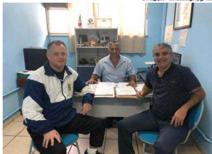
Mais informações na Secretaria Municipal de Esportes e Lazer