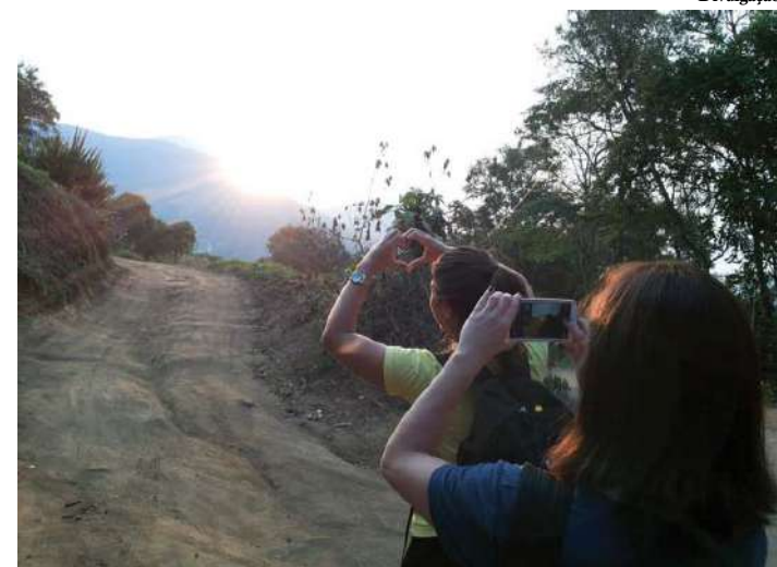
Hotéis e pousadas oferecem atividades ligadas à natureza

Passar as férias na praia já é coisa do passado para muitos turistas que procuram Petrópolis. Cercada por 70% de Mata Atlântica, hotéis e pousadas da cidade têm, a cada verão, ficado cada vez mais cheios com visitantes que vêm em busca do contato com o verde e a água doce das ca-