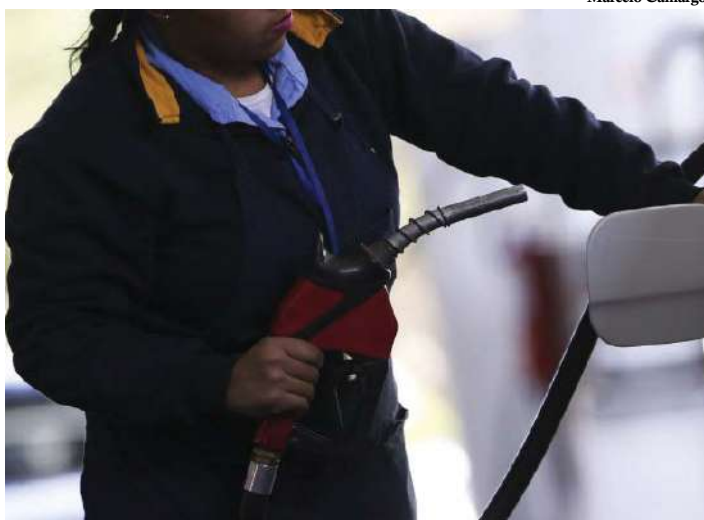
Preços dos combustíveis tiveram queda de 4,25% no último mês do ano

No acumulado de 2018, o Índice Nacional de Preços ao Consumidor Amplo (IPCA) foi de 3,75%, dentro da meta estipulada pelo governo federal, de 4,5% (com margem de erro de 1,5 ponto percentual para mais ou para menos). Em dezembro, o Índice teve variação de 0,15%, a menor para o último mês