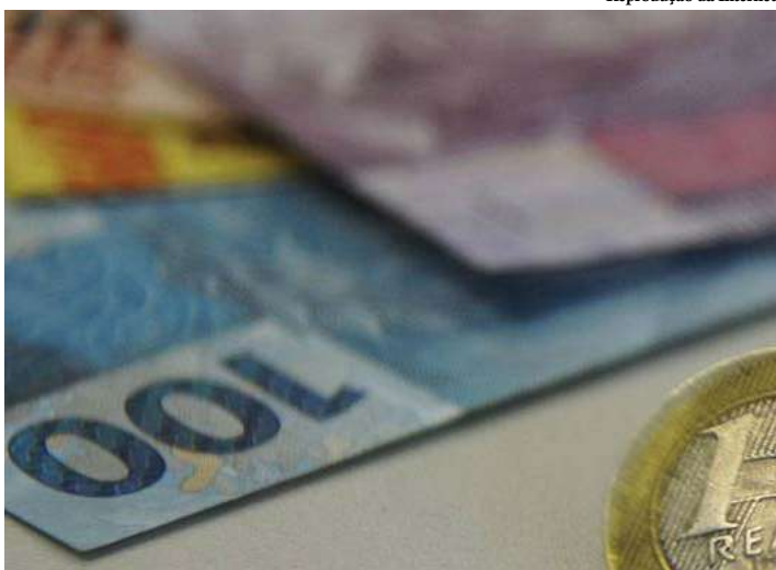
Melhora da economia deixou famílias menos receosas quanto ao desemprego

Os rumos da economia deixaram os brasileiros mais confiantes e satisfeitos com a vida. Levantamento da Confederação Nacional da Indústria (CNI) mostra que o medo do desemprego caiu 10,7 pontos de setembro a dezembro do ano passado, para 55 pontos, o menor nível da série histórica, iniciada