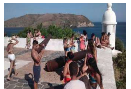
Prefeitura de Cabo Frio

Além da visita de turistas e amantes da história, o espaço também recebe visitas agendadas de escola e grupos. Para agendar uma visita, basta entrar em contato com a direção do Forte pelo e-mail: seculturacabofrio.fortesm@gmail.com ; através do perfil do Forte no Facebook; Espaço Cultural Forte São Mateus; ou através do telefone: (22)99223-5647.