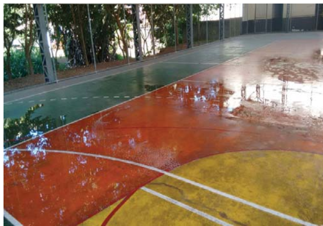
O espaço esportivo recebe limpeza periódica para atender aos usuários

Para tentar conhecer melhor a real situação das praças