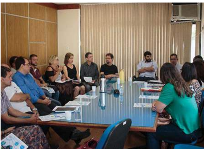
Foram abordadas diversas questões sempre com o intuito de promover melhorias no empreendedorismo

No último dia 16 de março em Cantagalo, ocorreu a primeira reunião do Comitê Gestor Municipal da Microempresa, Empresa de Pequeno Porte e Empreendedor Individual na sede da Prefeitura. A reunião contou com a presença da coordenação regional do SEBRAE/RJ, que trouxe importantes dados para o município e uma rica