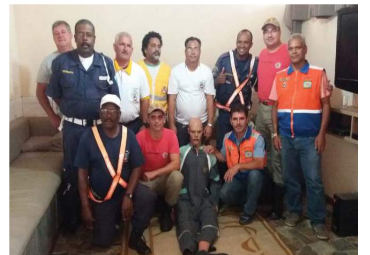
Foto tirada da equipe e instrutores após o Treinamento de Primeiros Socorros

Há duas semanas, através de parceria com o Destacamento 1/6 do Corpo de Bombeiros, foi oferecido à Guarda Municipal de Cordeiro o Treinamento de Primeiros Socorros, cuja abordagem teve como ponto fundamental passar aos integrantes da guarda noções básicas de atendimentos pré-