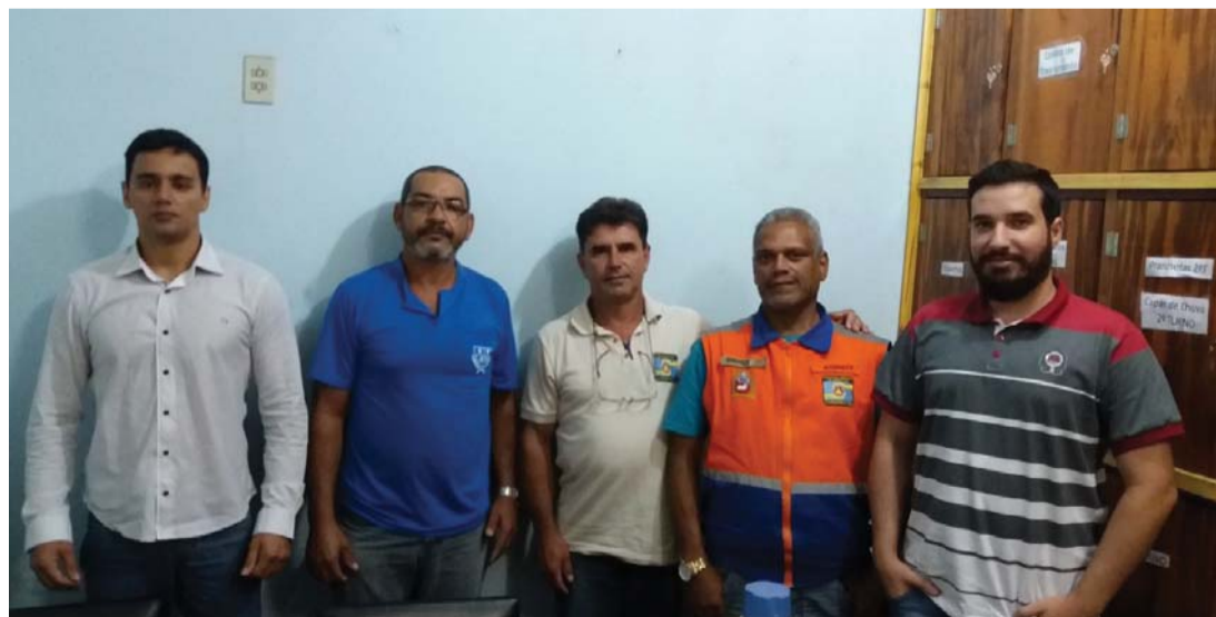
Defesa Civil estuda implantação da Guarda Mirim no município

Algumas cidades de Minas Gerais estão bem próximas de outras que integram o Estado do Rio de Janeiro. Contudo, embora sempre tenha sido notória a política da boa vizinhança e o convívio cooperativo entre as populações, nem