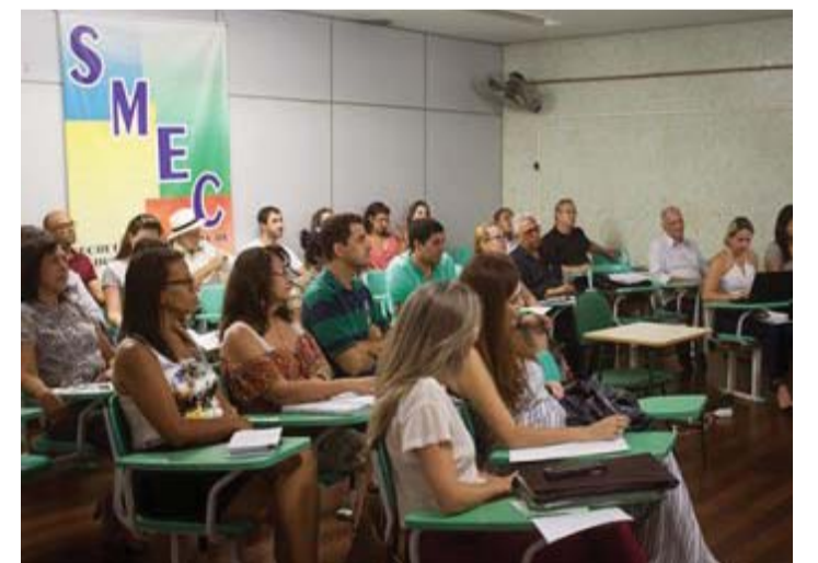
Reunião realizada no auditório da Secretaria de Educação de Cantagalo

Reunião realizada no último dia 25 de Janeiro, no auditório da Secretaria de Educação de Cantagalo, marcou o início dos trabalhos da rede dos agentes de desenvolvimento na região serrana no ano de 2017. Contando com a presença de representantes de 12 municípios, o evento destacou a operacionalização