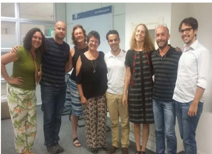
Autoridades após a reunião sobre o Complexo Cinematográfico de Cordeiro

Cordeiro pode, enfim, tirar do papel o desejo de voltar a ter um cinema. Esse é outro momento bastante animador vivido pelos dirigentes cordeirenses na capital fluminense, na última quinta-feira, 26, quando representantes da Cultura cordeirense se reuniram com a secretária estadual de Cultura, Eva Doris Rosental; a subse-