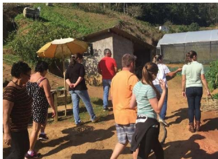
Segundo a ONU, 2017 será o ano do Turismo Sustentável para o Desenvolvimento

A Organização das Nações Unidas (ONU) declarou 2017 como sendo o Ano Internacional do Turismo Sustentável para o Desenvolvimento. Será uma oportunidade para fazer avançar a contribuição do agroturismo para os três pilares da sustentabilidade – econômica, social e ambiental.