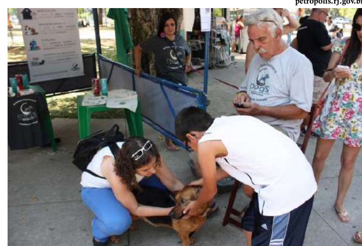
Ação é realizada em frente ao Parque Municipal em Itaipava

trais de conscientização, mobilização e doação de animais. Também participamos da elaboração dos planos Verão e Inverno, inserindo os animais no apoio às comuni-