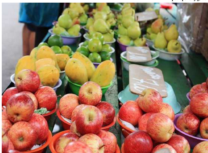
Cidade já está trabalhando na construção de uma feira especial, só com produtos orgânicos

Com mais de 100 produtores orgânicos em várias partes da cidade, Petrópolis conquistou o título de "Capital Estadual dos Produtos Orgânicos". A característica principal desse tipo de produção é a ausência de agrotóxicos, por isso, os alimentos orgânicos são os mais procurados por aqueles que buscam uma alimentação