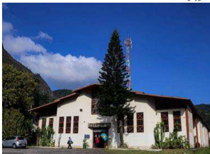
Casa do Artesão Pavilhão das Artes de Nova Friburgo fica na Rua Clóvis Beviláqua, 89 - Córrego

O Movimento Outubro Rosa acaba de ganhar um reforço de peso em Nova Friburgo. A Secretaria Municipal de Turismo e os artesãos da Casa do Artesão Pavilhão das Artes de Nova Friburgo firmaram uma importante parceria com a Associação da Mulher Mastectomizada - Amma.