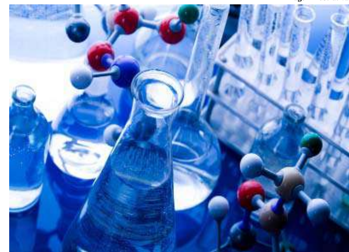
Edição 2018 bateu recorde de inscrições: 524

Sete jovens mulheres pesquisadoras brasileiras foram escolhidas para receber o prêmio Para mulheres na Ciência em reconhecimento pelos seus trabalhos. A iniciativa, que está em sua décima terceira edição, vai premiar cada pesquisadora com uma verba de R$ 50 mil para que elas possam aplicar em suas pesquisas.