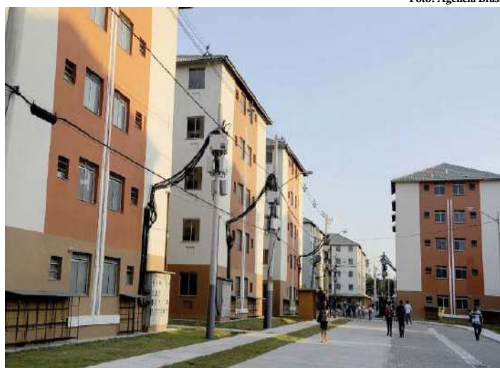
Moradias foram distribuídas por região geográfica, de acordo com a necessidade

O governo federal publicou, no Diário Oficial da União, a lista de propostas de empresas e entidades habilitadas para construção de 61.649 novas moradias do Minha Casa, Minha Vida. Serão beneficiadas famílias com renda de até R$ 1,8 mil.