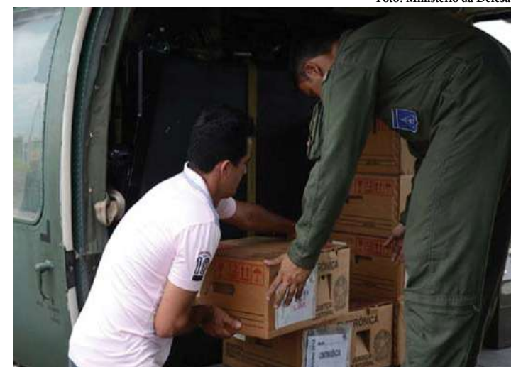
Pedido de uso das Forças Armadas deve ser feito pelos Tribunais Regionais Eleitorais ao TSE

Mais de 28 mil militares devem atuar nas eleições deste ano, tanto para assegurar a Garantia da Votação e Apuração (GVA) quanto para dar apoio logístico. Até o momento, a participação está confirmada em 598 localidades em 13 estados brasileiros.